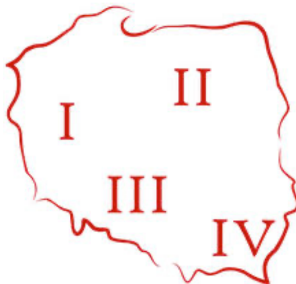
Rysunek 1 Sugerowany podział Mistrzostw Okręgu

Każdy z zespołów może startować jeden raz w Mistrzostwach Okręgu przypisanych do swojego regionu. W wyjątkowych sytuacjach zespół może wnioskować o start w innych Mistrzostwach Okręgu, natomiast tylko po wysłaniu pisemnego wniosku do zarządu oraz uzasadnieniu w nim przyczyny sytuacji. Zarząd w ciągu 14 dni zobowiązany jest udzielić pisemnej odpowiedzi. Regiony zostały podzielone ze względu na stężenie zespołów Mażoretkowych.