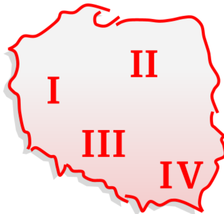
Rysunek 3 Sugerowany podział Mistrzostw Okręgu